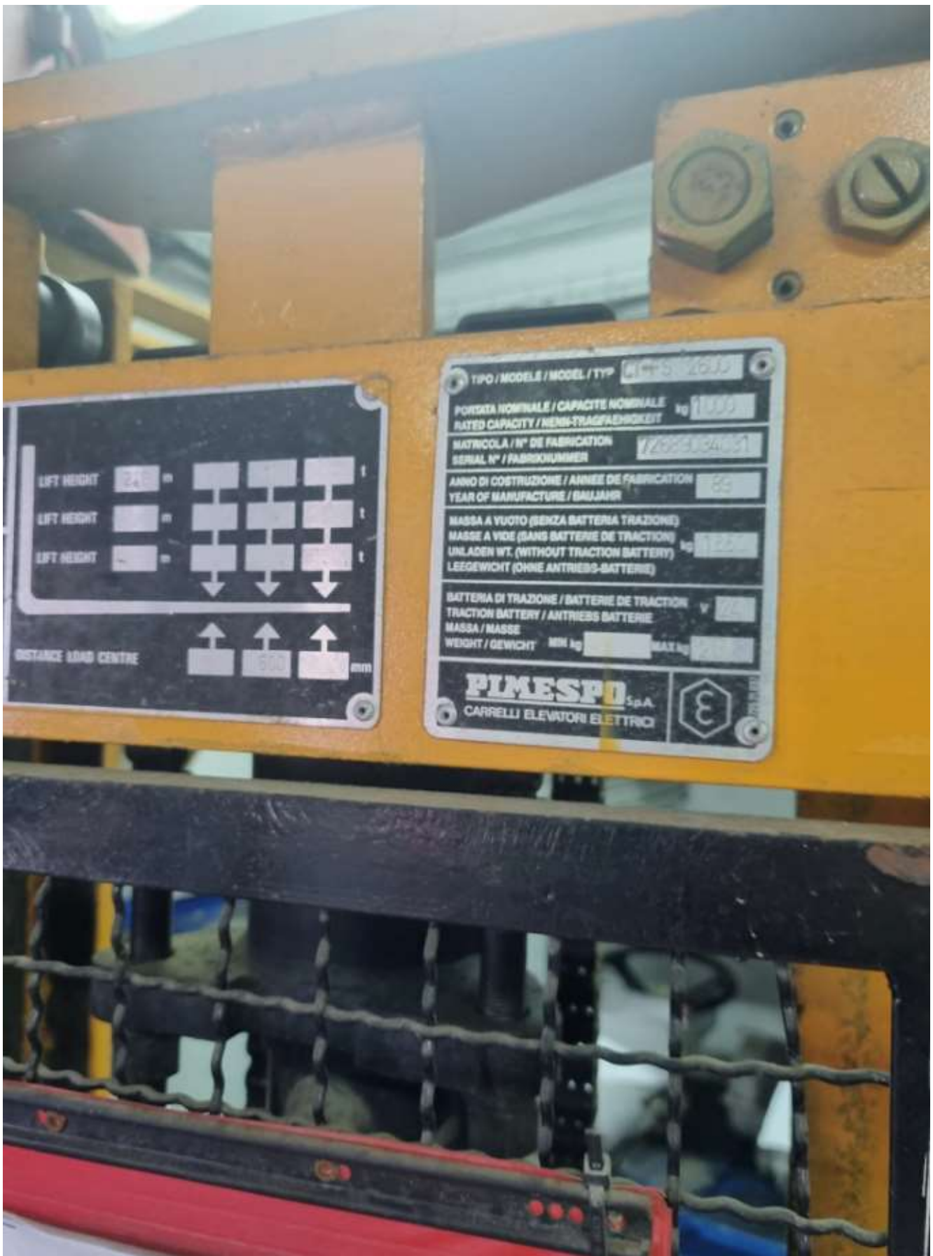
נספח ד' רישיון ציוד הנדסי + תסקיר בדיקה וניסוי מכונות הרמה